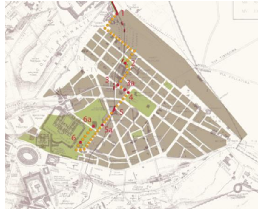
La planimetria del rione attuale è sovrapposta alla carta Roma antica di Giuseppe Lugli e Italo Gismondi del 1949; in giallo l'itinerario, in rosso le tappe.

L' architettura del paesaggio è la disciplina che si occupa dell'analisi, della progettazione e della gestione degli spazi aperti, dal giardino al parco al paesaggio. L'AIAPP rappresenta dal 1950 i professionisti attivi nel campo del Paesaggio, è membro di IFLA (International Federation of Landscape Architects) e di EFLA (European Federation of Landscape Architecture) e raggruppa oggi circa 550 Soci impegnati a tutelare, conservare e migliorare la qualità paesaggistica del nostro paese.